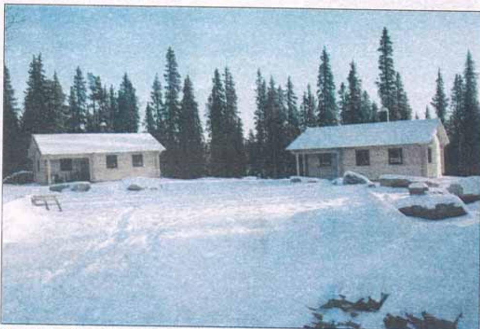
Stugorna ska bli fyra till antalet och inrymma totalt 22 bäddar. Lagom till att snön lade sig på marken var stugorna uppförda. Nu återstår att bygga klart invändigt.

med planerna. Mycket beror på hur vi kan utveckla ett samarbete med andra markägare, säger Christoph Schenk.